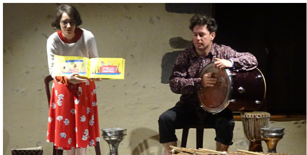
Musiques du monde

Début juillet, enfants et enseignants étaient heureux de retrouver le chemin de la bibliothèque déplacée au moulin. Ils ont assisté à un petit concert de musique, grâce à la malle « Musique du monde » prêtée par la médiathèque départementale du Puy-de-Dôme. Sur des rythmes et des voix, les enfants ont voyagé du Brésil à la Chine en passant par l'Afrique, la Syrie, le Portugal et l'Irlande. Autant de pays pour autant d'instruments que les musiciens ont présentés et joués avec talent pour accompagner les histoires de la bibliothèque. Ils ont écouté l'agogo ou cloche du Brésil qui donne le temps, la cabassa et le shekere qui enflamment le rythme ou encore le bodhran, le djembe et le balafon aux sonorités puissantes. Ils ont eu droit à une petite leçon sur le son lorsque le gong a résonné dans le moulin. Les interrogations, les réflexions et les appréciations des enfants ont aussi participé au succès de cette animation.