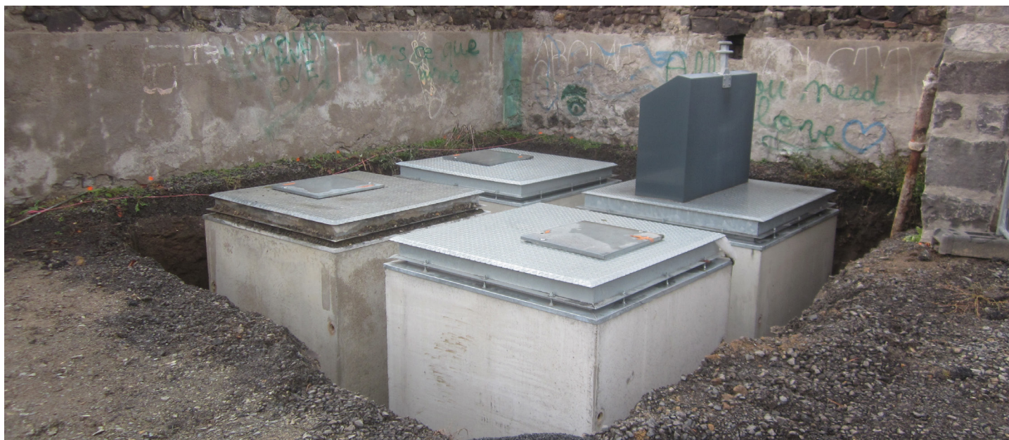
Installation du PAC place du Treix

Comme pour les PAC existants, c'est le modèle de colonne enterrée qui a été retenu, sauf pour les PAC de la rue de la Fonvielle qui auront des PAC semi-enterrés suite à un problème de faisabilité. Les travaux d'installation des PAC sont intégralement pris en charge du SBA. En revanche les aménagements périphériques, tels que l'espace de stationnement le temps de la dépose des sacs, seront à la charge de la Commune.